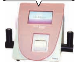
肌年齢測定器 ウエルビューティー