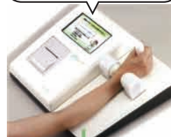
骨のセルフチェック Bone Wave